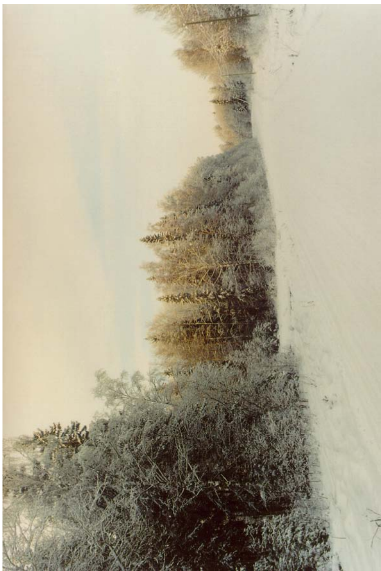
Ханинский лес. 2000 год.