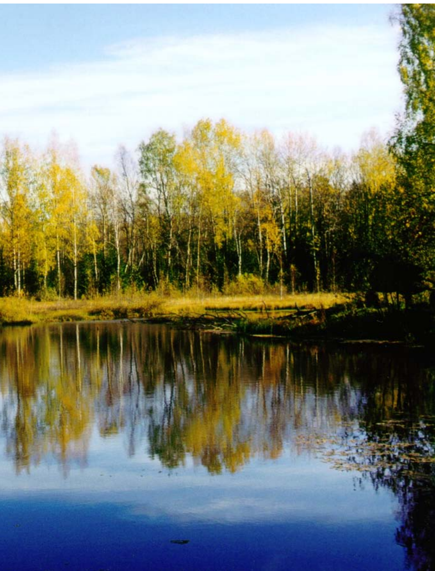
Искусственный водоем «Озерко» в усадьбе Никольское. 2000 год.